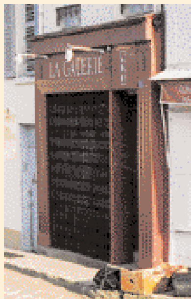
Dispositif fréquent d'éclairage d'une enseigne. ▼