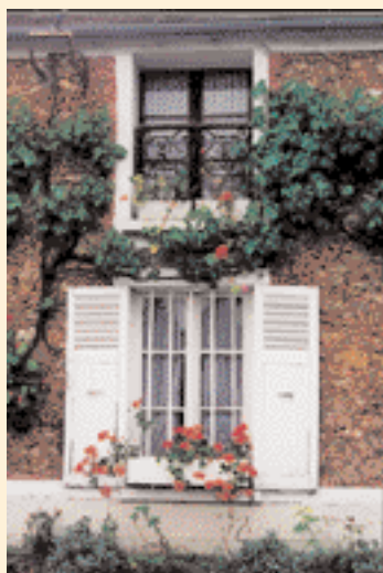
Le blanc crée un contraste très lumineux. ▼