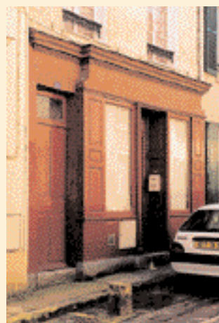
Les devantures anciennes dénotent d'une diversité qui s'adaptait à chaque contexte. ▶

Apparue à la fin du XVIII e siècle, elle est constituée d'un habillage menuisé et peint qui fait saillie sur la maçonnerie, encadre la ou les baies, et masque ainsi les murs du rez-de-chaussée. Certaines boutiques anciennes, par la valeur esthétique de leur devanture, par la qualité et la richesse de leur décor, appartiennent à notre patrimoine. Elles méritent, à ce titre, d'être sauvegardées. Chevreuse en conserve de nombreux exemples.