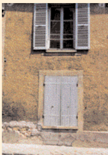
Les enduits de couleur ocre soutenue étaient fréquents sur les façades des maisons anciennes. ▼