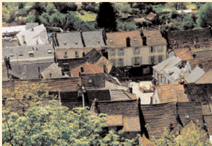
◀ À Chevreuse, l'ocre, le rouge et le brun des tuiles se mélangent au gris bleuté de l'ardoise.