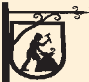
◀ Enseigne en drapeau en métal découpé.