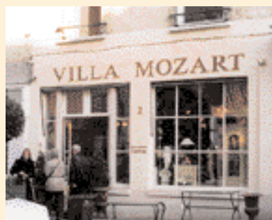
◀ Devantures en creux. ▶