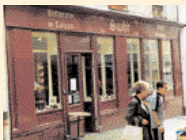
La qualité d'une devanture et de sa vitrine participe à l'attrait commercial. ▶