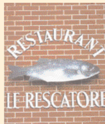
Enseigne peinte sur un mur. ▶

dessus de la vitrine ; elle peut figurer sur le lambrequin* d'un store ou encore être collée ou peinte sur la glace même de la vitrine côté extérieur comme intérieur.