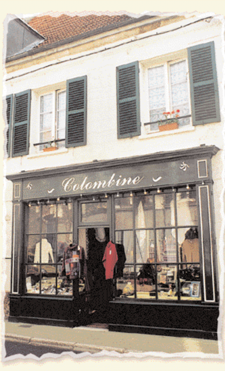
▲ Une réalisation bien intégrée à la composition générale de la façade.

L'impact d'une création de boutique ou celui de transformations apportées à une devanture se répercute sur l'ensemble de la rue. Il est d'autant plus fort que ces aménagements et réfections se produisent au niveau même des yeux du passant. La multiplication des enseignes ainsi que la trop grande variété des couleurs et des matériaux agressent l'œil du passant et vont à l'encontre de l'effet recherché. Ces excès de signes peuvent parfois même défigurer complètement le cadre architectural. Au contraire, un traitement sobre et simple repose l'œil du promeneur et met en valeur la vitrine du commerce.