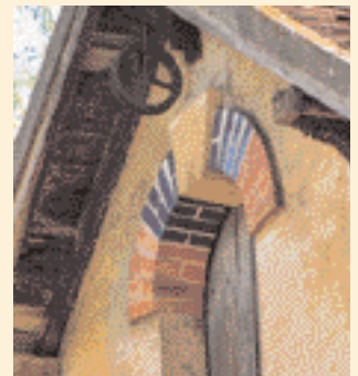
▲ Le décor peut être l'objet de touches ponctuelles de couleurs vives. ▼